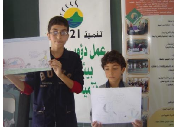
مدرسة الباهي لدغم

يتحصل التلاميذ على عدد في الورشات الثلاثة و يتم توزيع جوائز لثلاثة تلاميذ فائزين من كل مدرسة. * مدرسة الباهي لدغم :