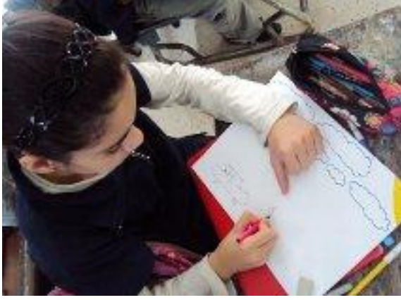
تلميذة من مدرسة سيدي صالح شطرانة

الجمعية المتحصلة على الجائزة الكبرى لرئيس الجمهورية في حماية الطبيعة والبيئة لسنة 2007 Grand Award of President of Republic for Environment Protection 2007