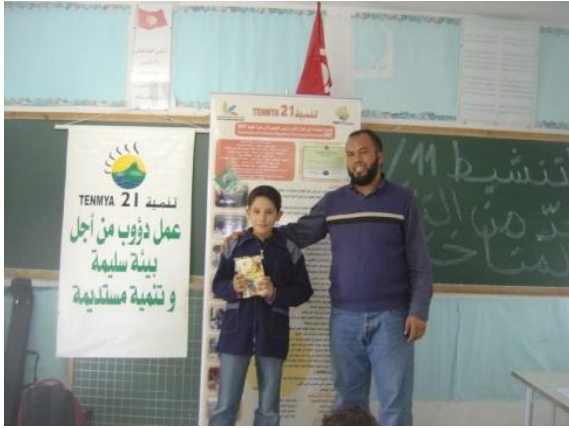
تسليم الجائزة الثانية

يتحصل التلاميذ على عدد في الورشات الثلاثة و يتم توزيع جوائز لثلاثة تلاميذ فائزين من كل مدرسة. * مدرسة الباهي لدغم :