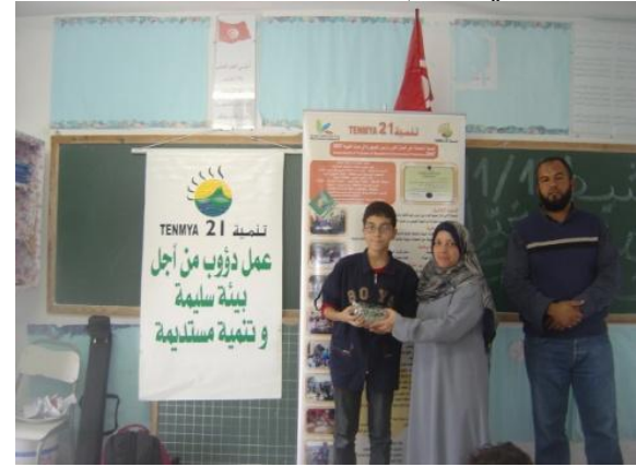
تسليم الجائزة الأولى